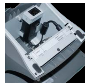
Adaptateur d'alimentation intégré